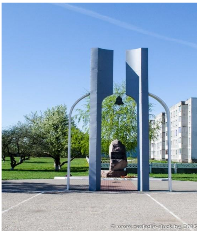
Слуцк – шталаг 362 – погибло 14 тыс. человек,