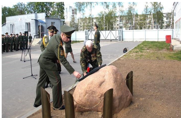
Борисов – шталаг 382 – погибло 10 тыс. человек.

Пленные часто размещались под открытым небом или в переполненных неотопливаемых бараках и сараях. Вывоз на территорию рейха, частью из-за недостатка транспортных средств, частью из-за безразличия немецкого руководства к судьбе военнопленных, практически не производился. Шансы выжить, прежде всего в первую военную зиму, у пленных солдат и офицеров Красной Армии были невелики.