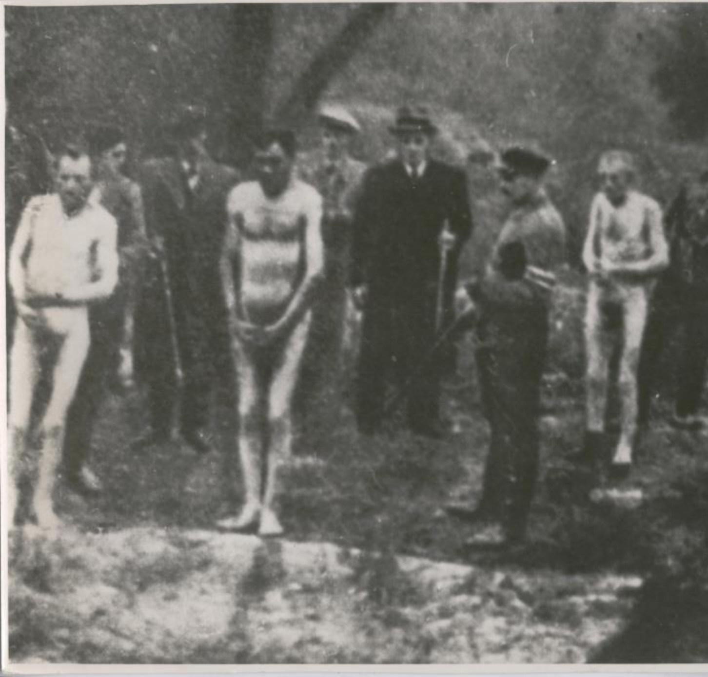
Гитлеровцы расстреливают мирных граждан.