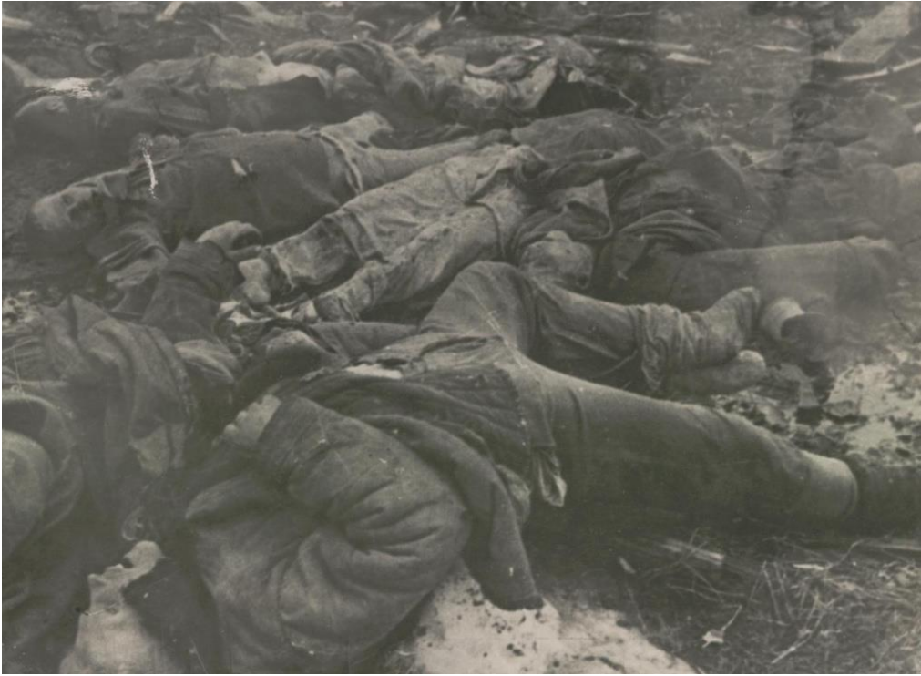
Неслыханные зверства чинили оккупанты над местным населением.