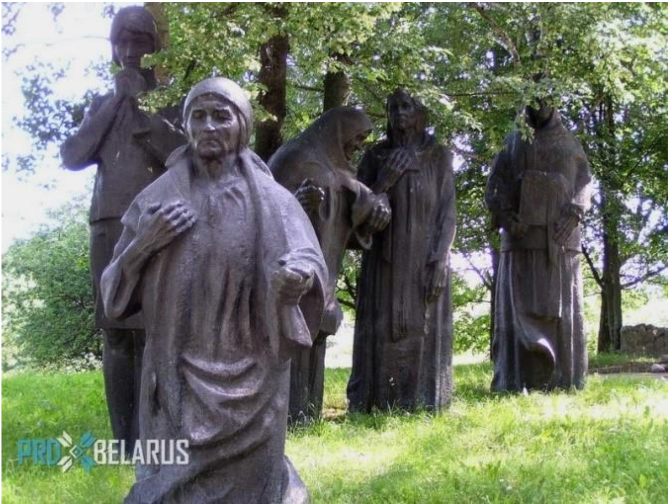
Мемориал в дер. Доры Воложинского района,